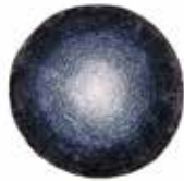
8 DIBBETS RAINBOW "ARCTIC" TEPPICH Ø CM 500