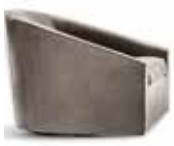
3 QUINN SESSEL CM 78X95 H70